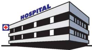
hospital مستشفى mustáxfa