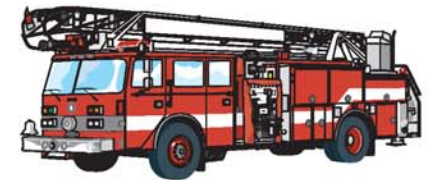
coche de bomberos سيارة إطفاء saiiárat ifá