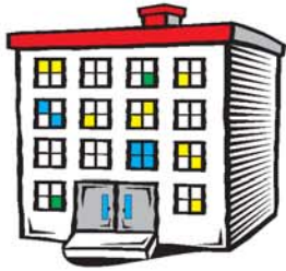
pisos طبقات tabqát