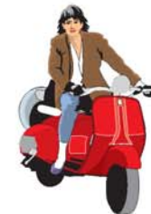
moto دراجة نارية darrácha nária