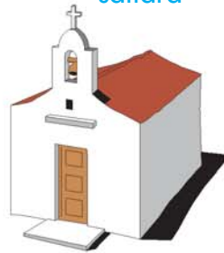
iglesia كنيسة kanísa