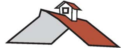
tejado سقف sáqf