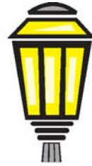
farola عمود إنارة amúd inára