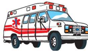
ambulancia سيارة إسعاف saiiáat isaáf