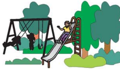
parque حديقة عامة hadíqa aámma