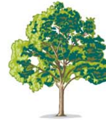
árbol شجرة sáchara