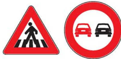
señales de tráfico إشارات الطرق ixarát at-túruq