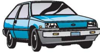
coche سيارة saiiára